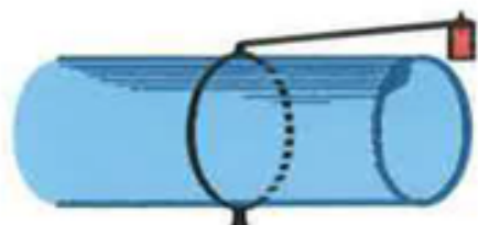
束取付タイプ / Bundle setting type