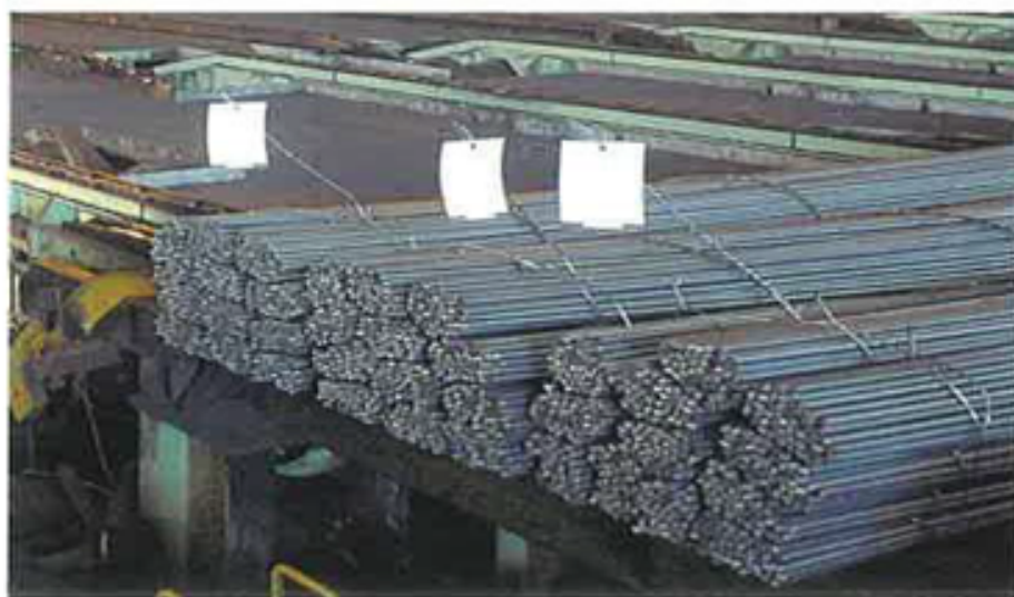
棒鋼タグ付け例 / Example of Tagging bundle