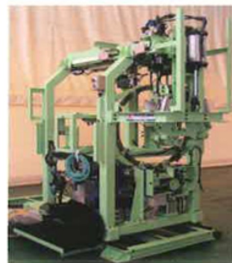
自動タグ付機 / Tag setting machine