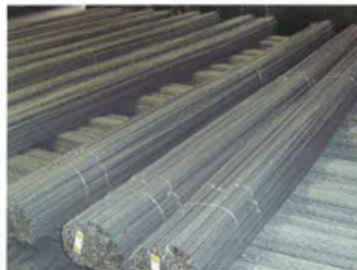
棒鋼製品 / Bar products