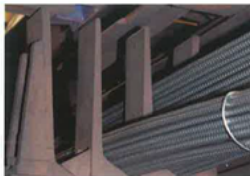
クシ式スタッカー / Comb style stacker