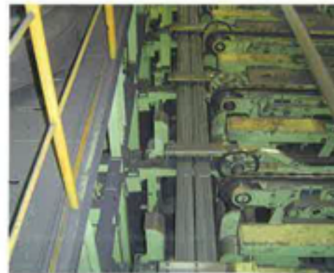
引き抜き式スタッカー / Pulling style stacker