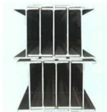
H鋼段積み例 / Example of stacking H beam